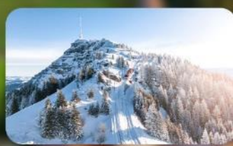
พิชิต 3 ยอดเขาดัง Rigi / Schilthorn / Gornergrat