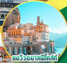
ชมวิวยามลึกลับ