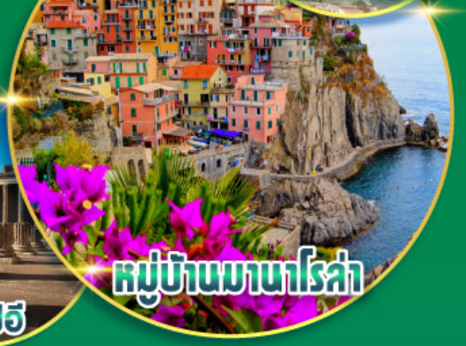
หมู่บ้านมาเรียโรซ่า