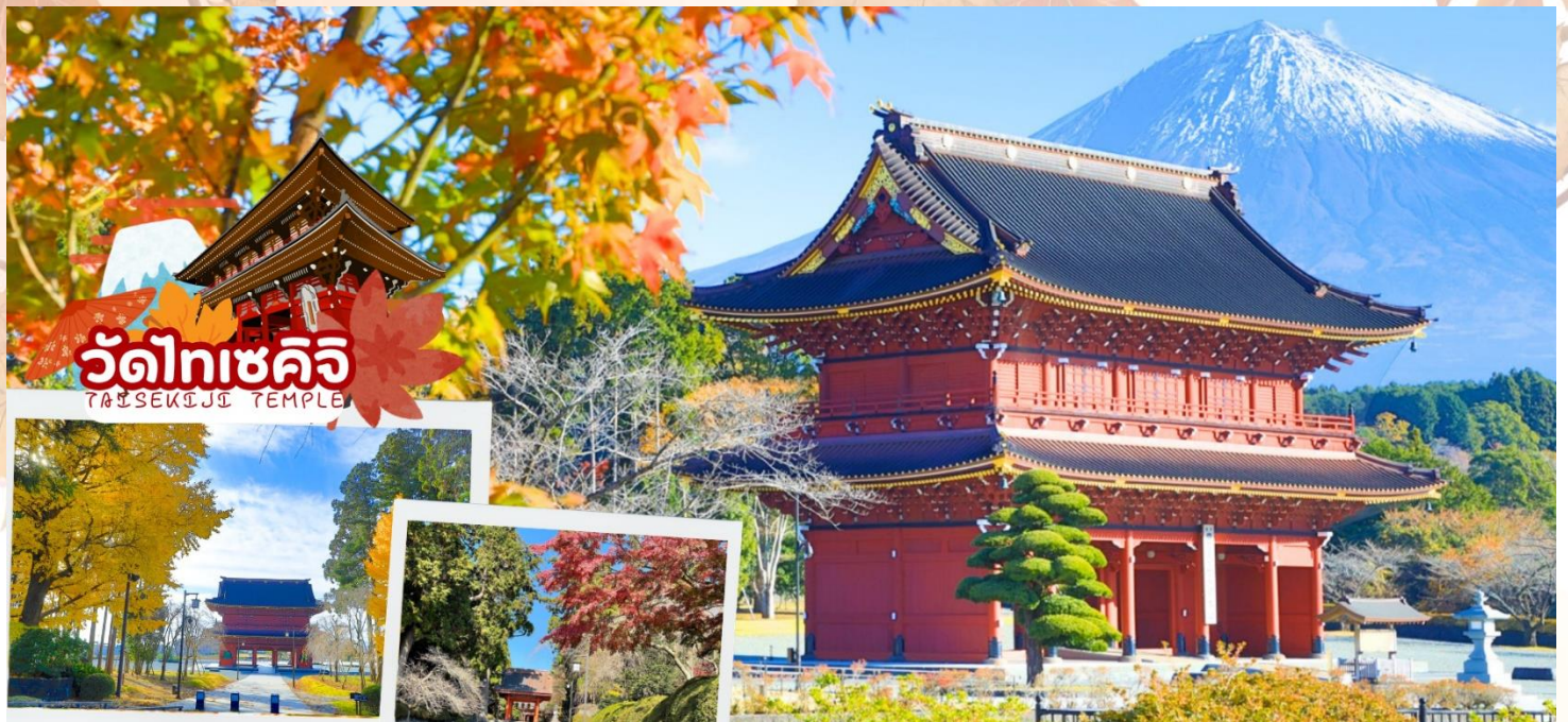
วัดไทเซคิจิ TAISEKIJJI TEMPLE

กลางวัน รับประทานอาหารกลางวัน ณ ร้านอาหาร (มื้อที่ 3)