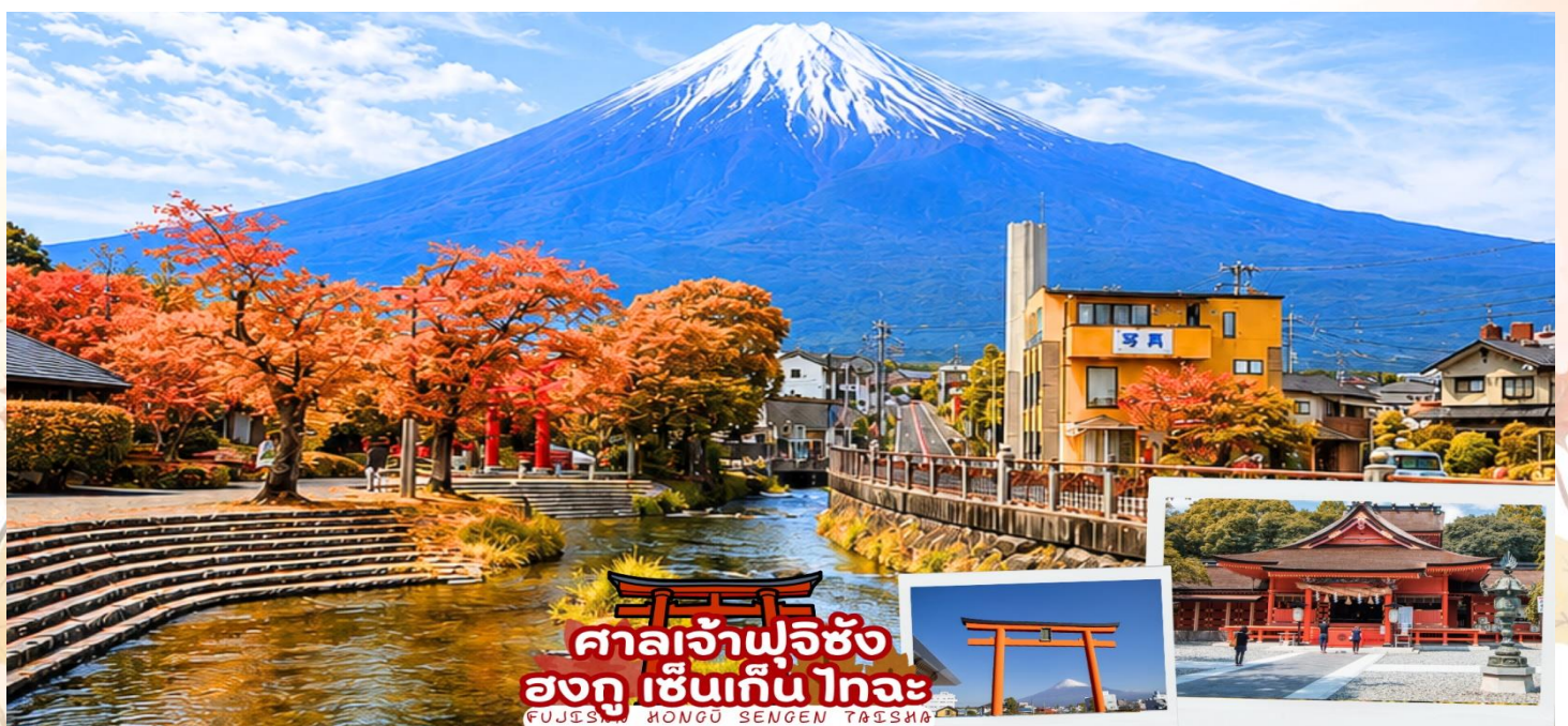
ศาลเจ้าฟูจิซัง ฮงกุ เซ็นเกิน ไทอะ FUJISAN HONGU SENGEN TAISHA

ศาลเจ้าฟูจิซัง ฮงกุ เซ็นเกิน ไทอะ (Fujisan Hongū Sengen Taisha) เป็นศาลเจ้าชินโต ตั้งอยู่ทางทิศตะวันตกเฉียงใต้ของฐานภูเขาไฟฟูจิ ในเมืองฟูจิโนะมิยะ จังหวัดชิซุโอกะ ครอบคลุมตั้งแต่ฐานภูเขาไฟฟูจิ ไปจนถึงยอดภูเขา ภายในศาลเจ้าเต็มไปด้วยความสงบ มีทั้งสถาปัตยกรรมแบบญี่ปุ่นโบราณ บ่อน้ำศักดิ์สิทธิ์ และวิวของภูเขาฟูจิที่งดงาม ศาลเจ้าแห่งนี้ตั้งอยู่ในตำแหน่งที่สามารถมองเห็นวิวภูเขาไฟฟูจิได้อย่างสวยงาม ด้วยบรรยากาศที่เงียบสงบและธรรมชาติรอบข้างสวยงาม ด้านหน้ามีน้ำไหลผ่านพร้อมกับเสาโทริสีแดง และภูเขาฟูจิ ทำให้ที่ศาลเจ้าแห่งนี้เป็นอีกหนึ่งจุดชมวิวภูเขาฟูจิและการถ่ายภาพที่สวยงามมาก