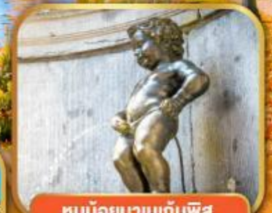
ทูน้อยมานเทินพิส