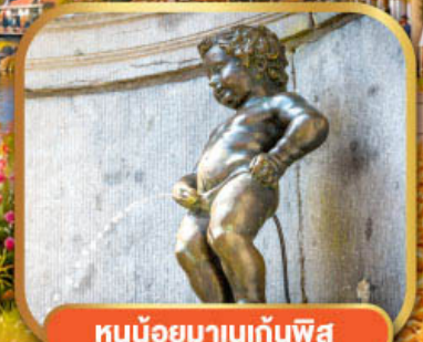
หนูน้อยมานเทินพิส