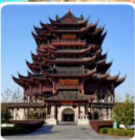
วัดดงหยวน