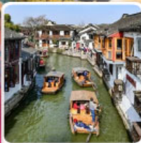
หมู่บ้านโบราณจูเจียเจียว