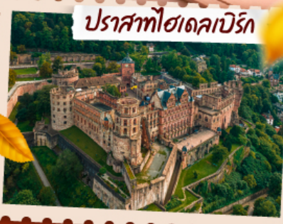
ปราสาทฮาเดเคบิร์ก