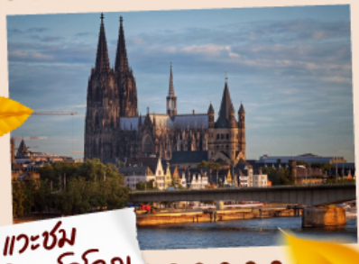
แควซ่ม มหาวิหารโคโลญ