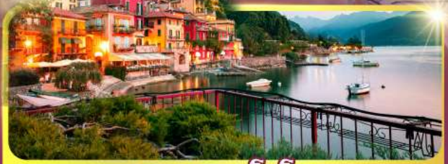
ทะเลสาบโลโบ

11-18 มิ.ย. 69 / 25 มิ.ย. - 02 ก.ค.69 02 - 09, 16-23 ก.ย.69 / 07 -14, 22-29 ต.ค.69 เดินทาง : 04 - 11, 11-18 พ.ย.69 25 พ.ย. - 02 ธ.ค.69 03 - 10, 23-30 ธ.ค.69 / 23 - 30 ธ.ค. 69 29 ธ.ค.69 - 05 ม.ค.70