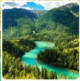
ทะเลสาบคานาสือ