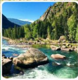
อุทยานเคอเคอทัวไห่