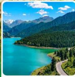
อุทยานเทียนชาน เทียนฉือ