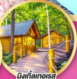
มิงก้าไกโอะสะ