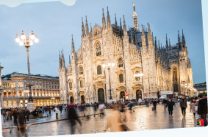
คูโอโม มิลาน