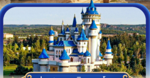
ปราสาทเทพนิยายซาโฮวา