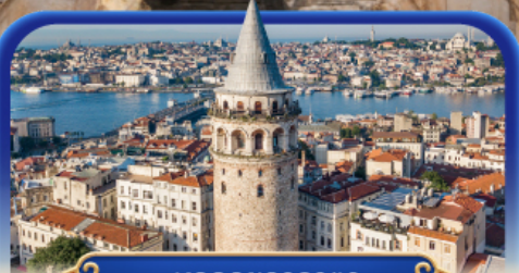
หอคอยกาลาตา