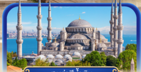
สุหรัสน้ำเงิน