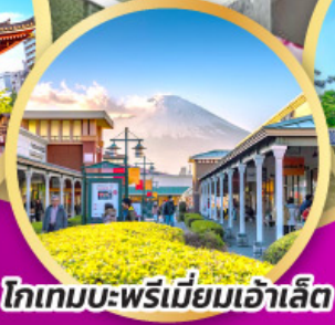
โทเกมบะพรีเมียมเจ้าเล็ด