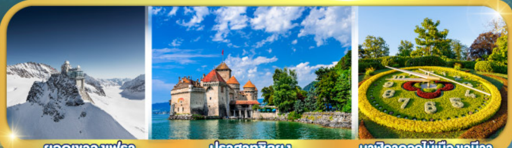
ยอดเขาจุงเฟรา ปราสาทชิลอง นาฬิกาดอกไม้เมืองเจนีวา

กระเช้าไอเกอร์ : ยอดเขาจุงเฟรา | กระเช้า : ยอดเขาโคลน์แมทเทอร์ฮอร์น กับ ดินแดนห้าหมู่บ้านสวิสแควนแดร์