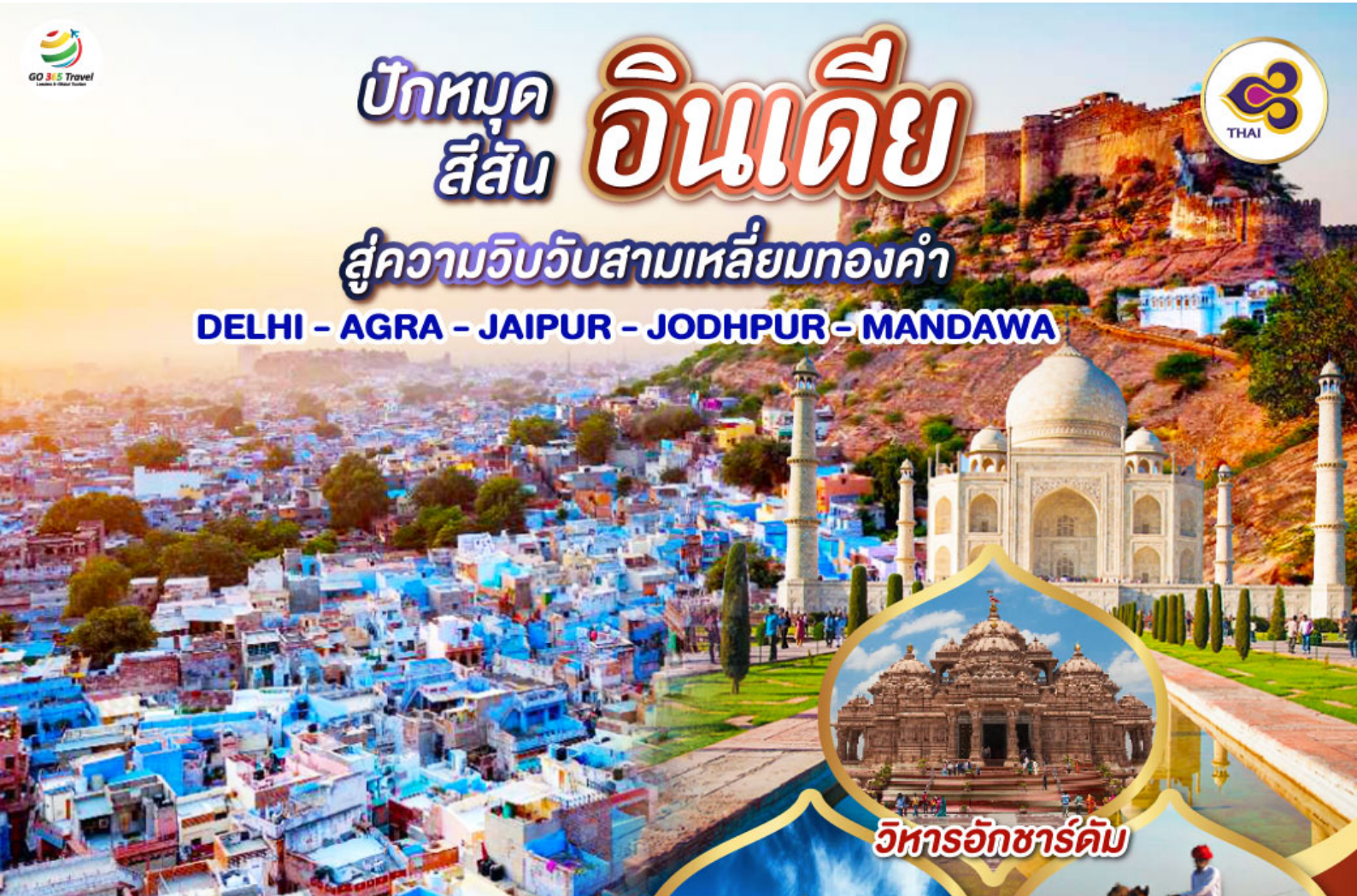
วิหารอักซาร์คัม

DELHI - AGRA - JAIPUR - JODHPUR - MANDAWA