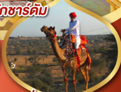
ฟรี ขี่อูฐ เมืองมันทวา ราคาเริ่มต้น