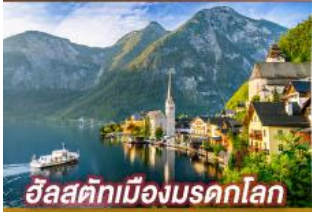
อัลสติกเมืองมรดกโลก