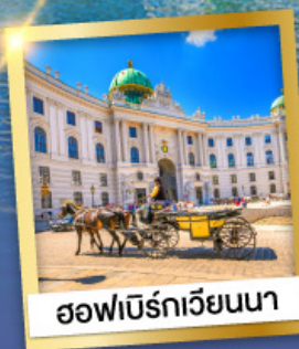
ฮอฟเบียร์เกเวียนนา