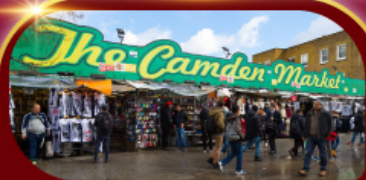
ตลาดแคมเดน