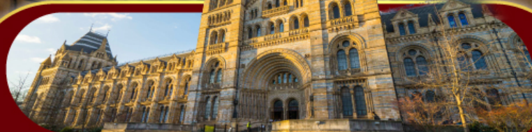
พิพิธภัณฑ์ประวัติศาสตร์โลกทางธรรมชาติ