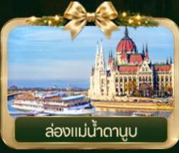
ล่องแม่น้ำดานูบ