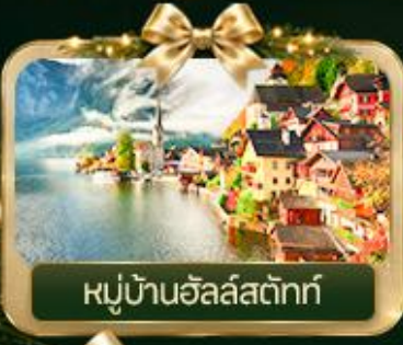
หมู่บ้านฮัลล์สตัดท์