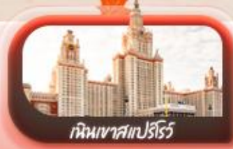
เหมินเขาสเปิร์สโรว์