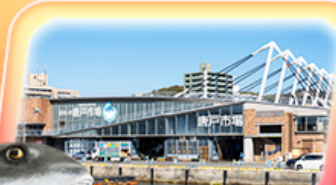
ตลาดปลาอาราโตะ