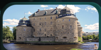
ปราสาทไอเรโบร