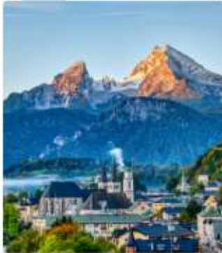
ออสเตรียบาวาเรียดินแดน แห่งเทพนิยาย