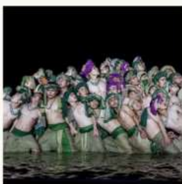
ชมโชว์ Hoi An Memories