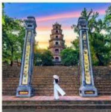
วัดเทียนมู่