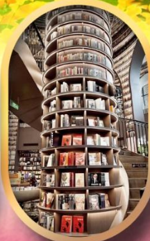
อุทยานปีติงโกว