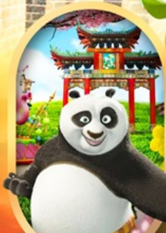
OPTION Universal Studios