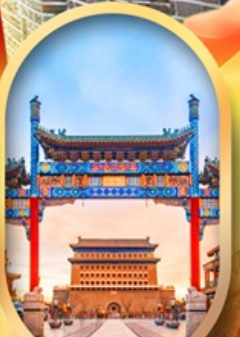
ถนนคนเดินเจียนเหมิน