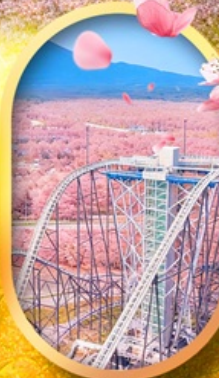
ฟูจิยาม่า ทาวเวอร์