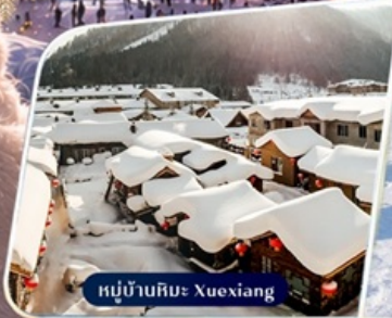
หมู่บ้านหิมะ Xuexiang