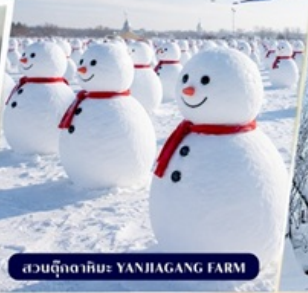
สวนตุ๊กตาหิมะ YANJIANG FARM