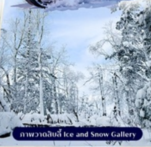
ภาพวาดด้วยน้ำแข็ง Ice and Snow Gallery