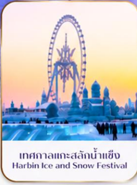
เทศกาลแกะสลักน้ำแข็ง Harbin Ice and Snow Festival