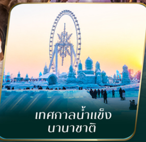
เทศกาลน้ำแข็ง นานาชาติ