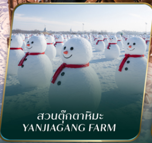
สวนตุ๊กตาหิมะ YANJIAGANG FARM