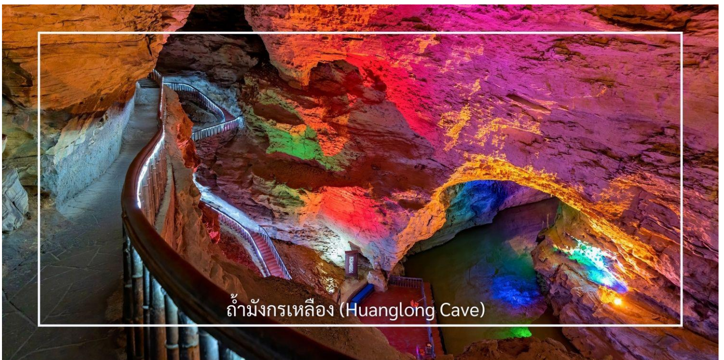
ถ้ำมังกรเหลือง (Huanglong Cave)

ถ้ำมังกรเหลือง หนึ่งในถ้ำหินงอกหินย้อยที่ยิ่งใหญ่และงดงามที่สุดของเมืองจางเจียเจี๋ย แหล่งท่องเที่ยวทางธรรมชาติที่ได้รับการยกย่องว่าเป็น “พระราชวังใต้พิภพ” แห่งดินแดนอุหลิงหยวน ถ้ำแห่งนี้มีโครงสร้างขนาดใหญ่ แบ่งออกเป็น 4 ชั้น ภายในประกอบด้วยห้องโถงกว้างใหญ่ ลำธารใต้ดิน บึงธรรมชาติ และแนวระเบียงหินที่ทอดยาวอย่างน่าตื่นตา ความมหัศจรรย์ของหินงอกหินย้อยซึ่งก่อตัวสะสมมาเป็นเวลาหลายล้านปี ได้รับการจัดแสงอย่างสวยงาม ช่วยขับเน้นรูปร่างแปลกตาให้โดดเด่น ราวงานศิลป์จากธรรมชาติ สัมผัสประสบการณ์ ล่องเรือชมแสงสีภายในถ้ำ โดยเรือจะนำท่านลัดเลาะไปตามสายน้ำใต้ถ้ำให้ท่านได้สัมผัสกับความยิ่งใหญ่ของธรรมชาติอันน่าอัศจรรย์ได้อย่างใกล้ชิด