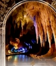
ดำโพรมิรัฐอส BOAT RIDE

เดินทางช่วงปีใหม่ 27 ธ.ค. - 3 ม.ค. 70 ราคาเพียง 75,989 บาท / ท่าน