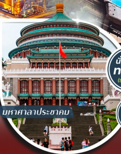
มหาศาลาประชาชน