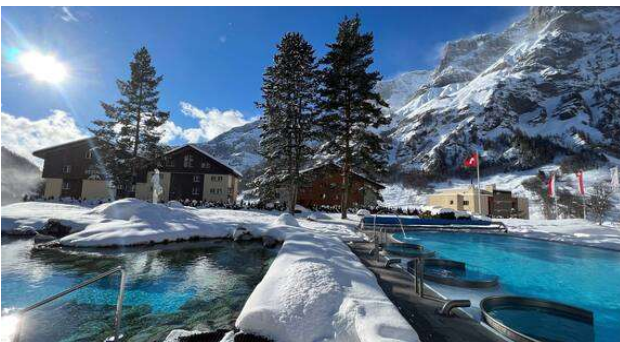
เมืองสปา Leukerbad