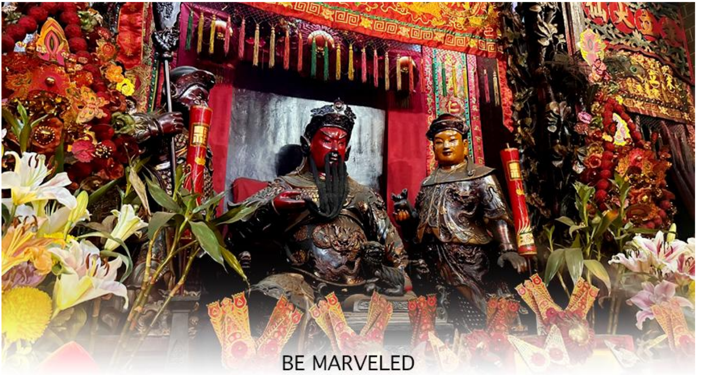
BE MARVELED วัดกวนอู

คงไม่ให้เพลิงพลาแกศัตรู ทำให้มีมิตรที่ซื่อสัตย์ และคุ้มครองบริวารให้ก้าวหน้าและอยู่เย็นเป็นสุข ซึ่งผู้ประกอบอาชีพ ตำรวจ ทหาร และ นักการเมือง จึงมักจะนิยมบูชาเทพเจ้ากวนอู เป็นพิเศษ