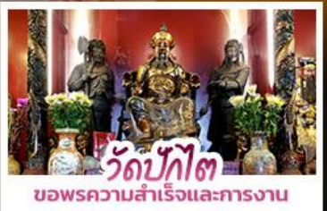
วัดบักโต ขอพรความสำเร็จและการทำงาน