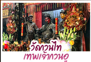
วัดวนิโท เทพเจ้ากวนอู