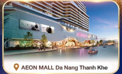
📍 AEON MALL Da Nang Thanh Khe