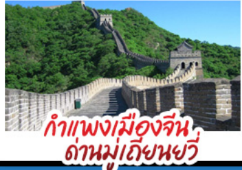
กำแพงเมืองจีน ด่านมู่เทียนยวี่