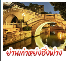
ย่านเก่าเซียงซิงฟาง