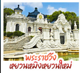
พระราชวัง เฉียนเหมิงเฉียนเหมิง