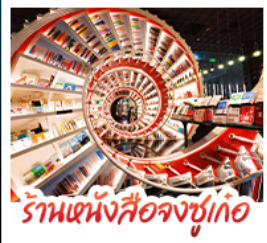
ร้านหนังสือจงซูเกอ