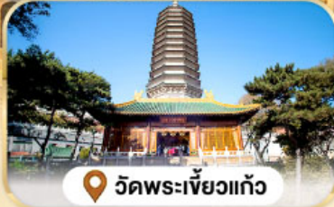
วัดพระเจี๋ยกั๋ว