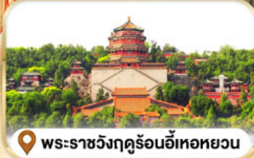
พระราชวังฤดูร้อนอี่เหอหยวน