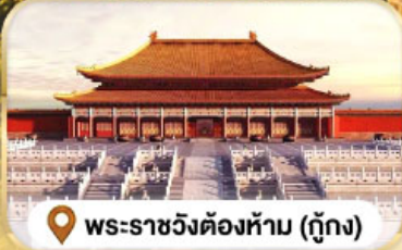
พระราชวังต้องห้าม (กู้กง)