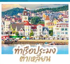
ท่าเรือประมง ต้าเหลียน