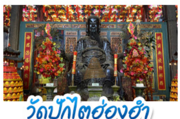
วัดปักไต้ฮ่องกง