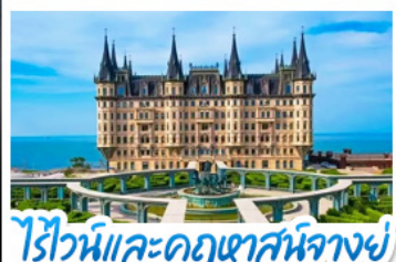
ไรไวน์และคฤหาสน์นางอยู่