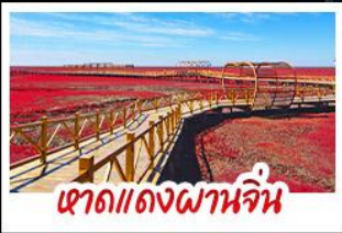
หาดแดงผานจิน