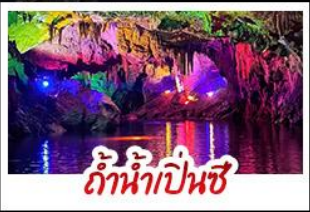
ถ้ำน้ำเป็นสี