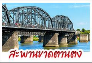
สะพานหวาดถานตง

2 มหัศจรรย์ธรรมชาติระดับโลก "หาดแดงผานจิน" คู่กับ "ถ้ำน้ำเป็นสี" ยืนมองฝั่งเกาหลีเหนือที่ตามอง • ชมความยิ่งใหญ่ของพระราชวังเส้นหยางกู่กิง