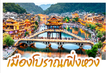
เมืองโบราณเฟิงเฉวง