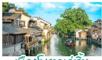
เมืองโบราณอู๋เจิน