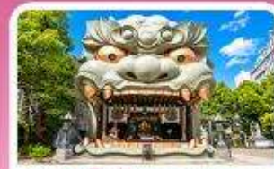
ศาลเจ้านัมมะ ยาชากะ