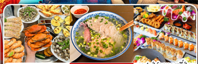
บุฟเฟ่ต์ซีฟู้ด | เมนูจีนเร็กซ์เดม (บุ๊ฟ) | บุฟเฟ่ต์อาหารญี่ปุ่น Bababa Japanese Restaurant