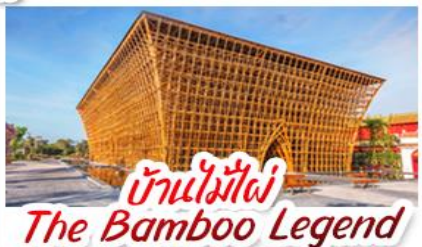
บ้านไม้ไผ่ The Bamboo Legend