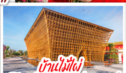
บ้านไม้ไผ่ The Bamboo Legend