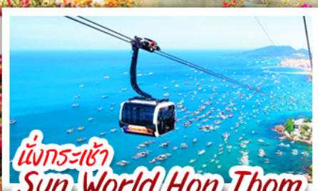
นั่งกระเช้า Sun World Hon Thom