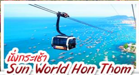
นั่งกระเช้า Sun World Hon Thom