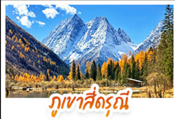
ภูเขาสัตรีณี

ชมทะเลสาบสีฟ้ามรกต ณ จิวจ้ายโกว • เช็กอิน "ภูเขาสัตรีณี" สัมผัสความงดงามของใบไม้เปลี่ยนสี ชมทิวทัศน์ภูเขาหิมะติดกับผืนป่าสีทอง • ชมแอ่งน้ำสีฟ้ามรกตสุดมหัศจรรย์ ณ อุทยานหลวงหล่ม • ช้อปปิ้งจิวจ้ายโกว ถนนที่เก๋ที่สุด และถนนคนเดินชุมชนฮั่วพิเศษ! มังกรไฟความเร็วสูง 1 ไร่ สูดมิ่งอิงคู