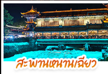
สะพานเจ้านานเฉียว