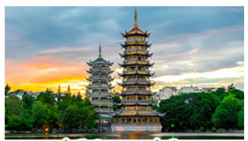
เจดีย์จินเจดีย์ทอง