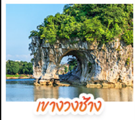
เขาวงวงซ้าง