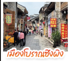
เมืองโบราณเซียงผิง

เช็คอินจุดไฮไลต์โลกเที่ยวหลิน เจดีย์เงินเจดีย์ทอง เหวางวงซ้าง นั่งเคเบิลคาร์สู่ เหวาหรือ จุดชมวิวกะหลกเวา แห่งเมืองหยางชั๋ว ล่องเรือแม่น้ำลู่เจียง ตามรอยช้างหลังกาพรนบัตร 20 หยวน อิสระช้อปปิ้งถนนคนเดิน 2 แห่ง ถนนตงซีเซียง ถนนซีเซียง นั่งกระเช้าบอลูนชมวิวแบบ 360 องศา