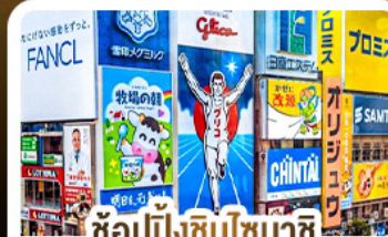
ช้อปปิ้งชินโซบาชิ และโดตงโมริ