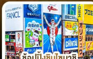
ช้อปปิ้งชินโซบาชิ และโดตงโบริ