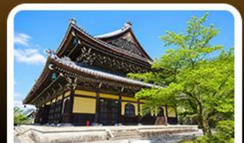
วัดนินเน็นจิ