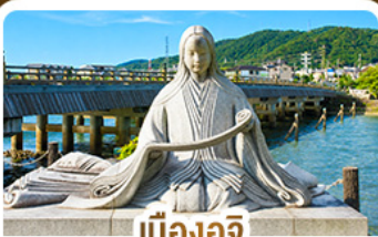
เมืองอูจิ สวรรค์คนรักชาเขียว